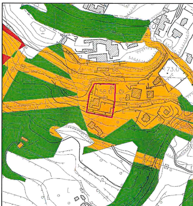
STRALCIO DEL PSAI – CARTA DEL RISCHIO DA FRANA VIGENTE